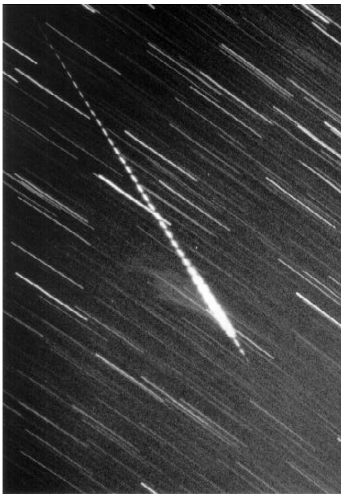
Boven : -4 Leonide in Eridanus. 16 november 1998 18h16m36s UT. Xing Long. Simultaan met Lin Ting Kou.