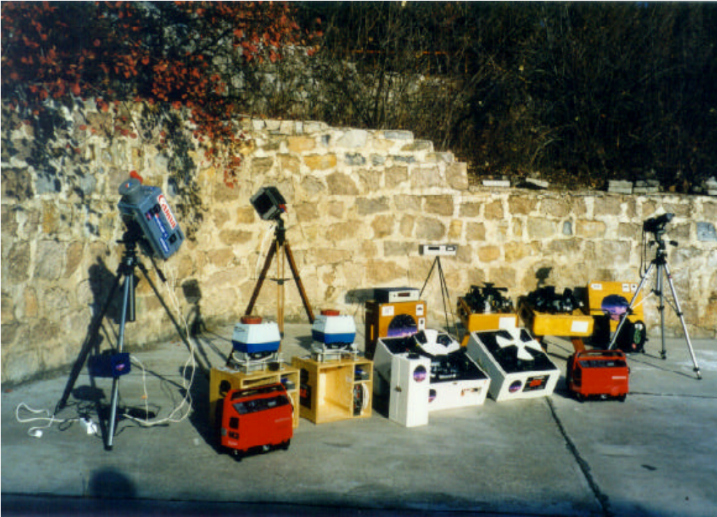
Links : Parade opstelling voor de pers. De apparatuur van de posten Xing Long en Lin Ting in het late winterzonnetje. Vier camerabatterijen, twee EN all-sky toestellen, twee generatoren, twee video beeldversterkers en een spectrograaf staan paraat in China.

“Don’t wolly” hehaalde Hu eindeloos, “stlong winds are coming”. Nee, we hoefden niet bang te zijn voor sneeuw. Het zou glashelder worden. De temperatuur daalde rap. Verwarming van de batterijen op hoog. Het vertrouwde gierende geluid van Pavels sectoren Stoelen met elektrische dekens. Xing Long is op alles voorbe-