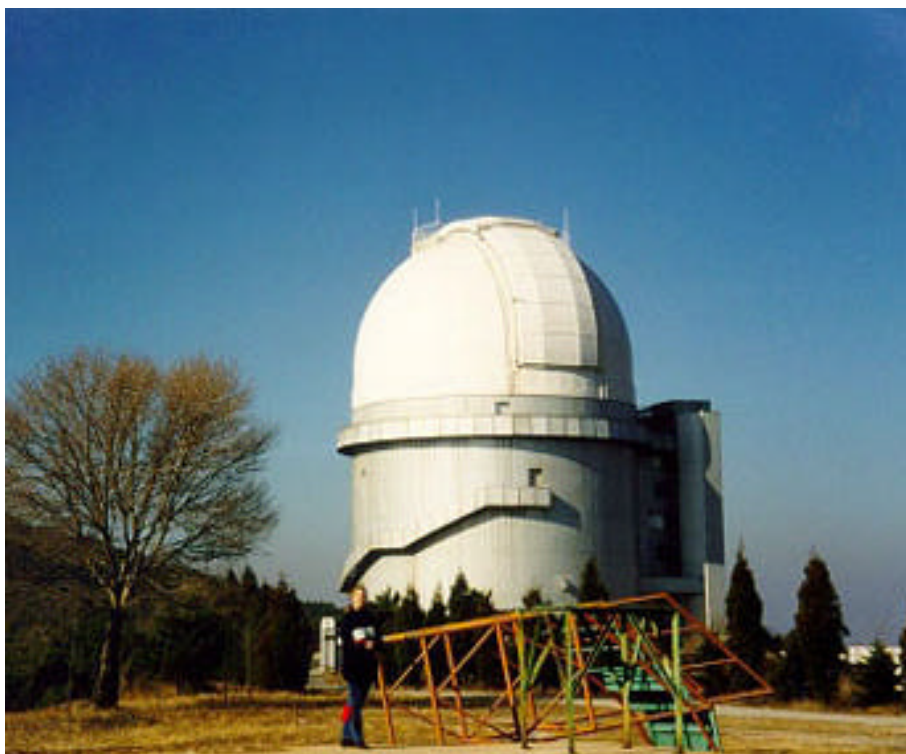
Links : De koepel van de 2 meter telescoop is dominant op het uitgestrekte terrein van Xing Long observatory.

nuten later staan we voor het hek van de sterrenwacht en worden soepeltjes binnengelaten.