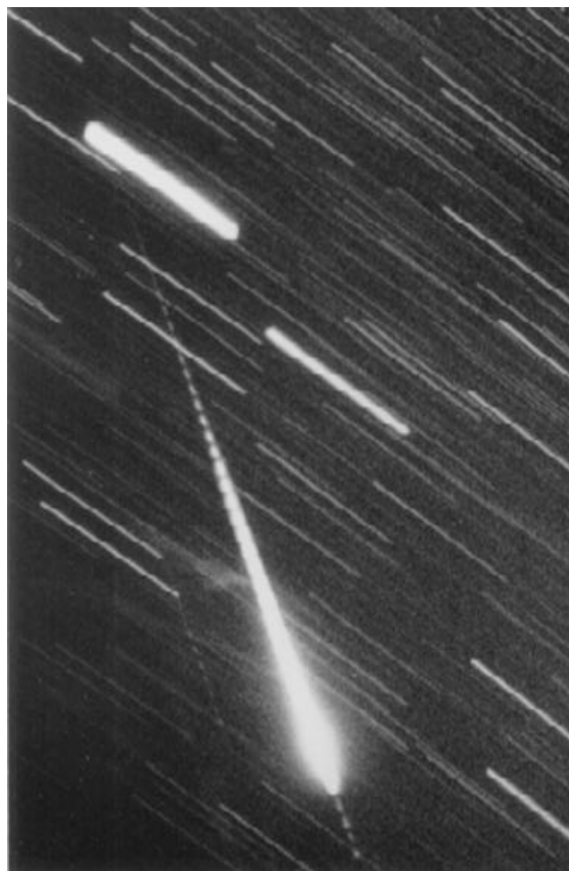
Boven : -10 Leonide in CMa. 16 november 1998 20h15m36s UT. Xing Long. Simultaan met Lin Ting Kou.