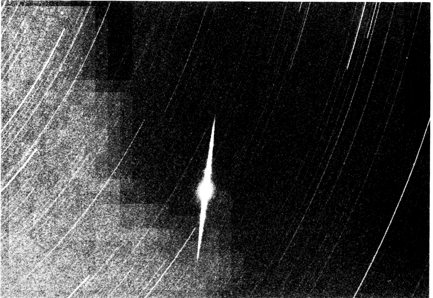
Figure 2: Detailopname van de opname van Gordon Garradd vanuit Tamworth met een Nikon f/5.6-16mm fish-eye lens.

opnamen vanaf het zuidelijk halfrond door REDCON verwerkt zijn. Gezien de andere rotatierichting waren wellicht aanpassingen in de vorm van de nodige min-tekens te verwachten. Een en ander bleek mee te vallen.