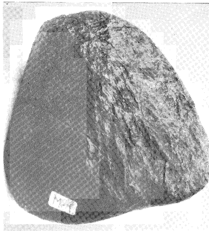
Figure 2: De mogelijke meteoriet van Vroomshoop. Hij meet 9 \times 8 \times 7 cm. The possible meteorite of Vroomshoop.

De steen vertoont geen "duimafdrukken" aan het oppervlak, typisch voor ijzer meteorieten, noch is een smeltkorst herkenbaar, kenmerkend voor vers gevallen steen meteorieten. Dit laatste sluit de mogelijkheid uit dat de steen het restant is van de vuurbol die over Hamm (WDld.) en Eibergen (Ndl.) bewoog op 28 augustus 1984. Ook is de vindplaats van de meteoriet niet in overeenstemming met het door de heer A. Scholten berekende traject [2].